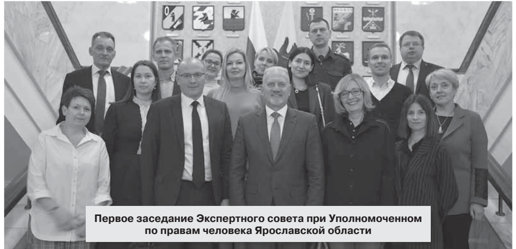
Первое заседание Экспертного совета при Уполномоченном по правам человека Ярославской области

ческого сообщества, эксперты в области защиты отдельных отраслей права, практикующие адвокаты и юристы, представители региональной журналистики. Активно развивается созданный в прошлом году Молодежный экспертный совет — его члены проводят мониторинговые исследования, организуют приемы граждан и просветительские мероприятия для школьников, студентов и рабочей молодежи.