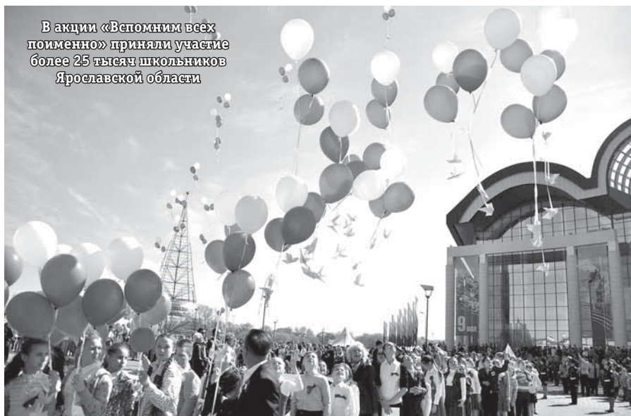
В акции «Вспомним всех поименно» приняли участие более 25 тысяч школьников Ярославской области